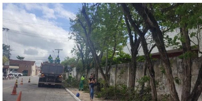
Avenida Paulino Mendes

Se tornou de conhecimento público e com notória habitualidade um procedimento rotineiro e em rápida evolução de podas drásticas e supressão de árvores e vegetação no meio ambiente urbano desta municipalidade.