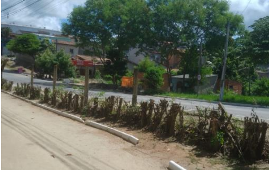
Parque Ecológico Gravatá