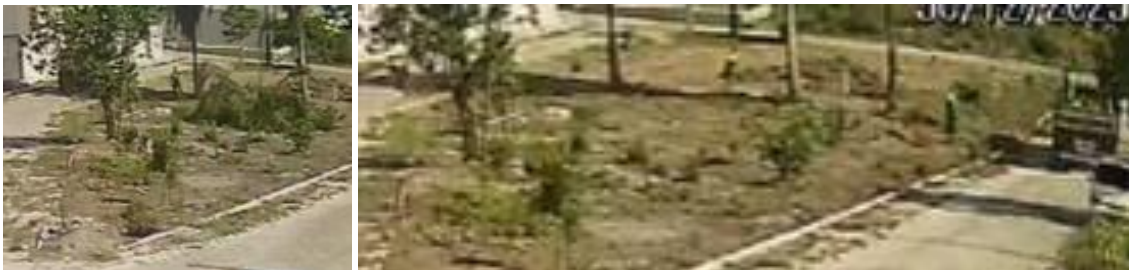
Bairro Jardins de Eunápolis